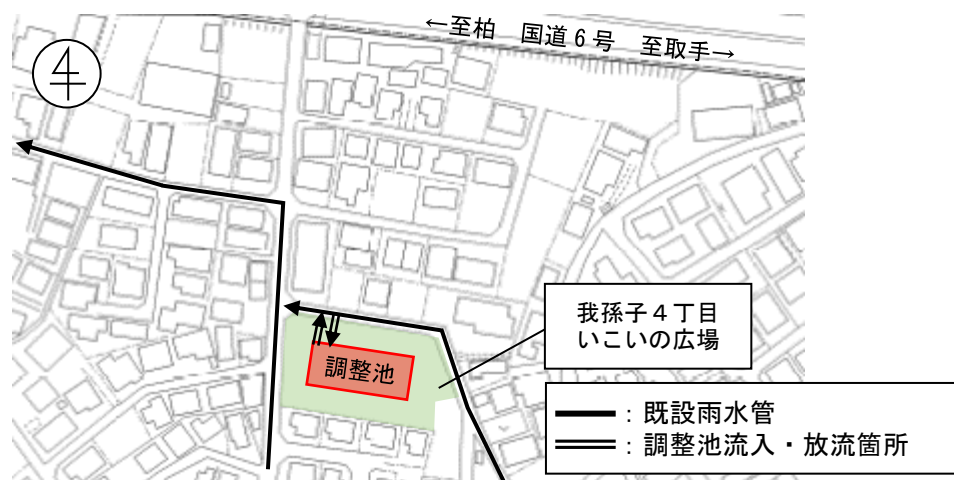
我孫子駅北口浸水対策事業の概要図