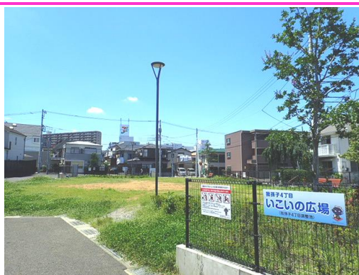
我孫子4丁目いこいの広場 (調整池上部)