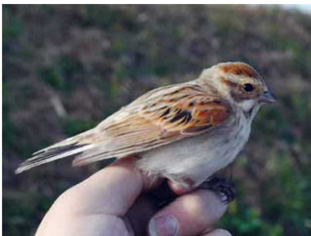
写真1. 手賀沼周辺で再捕獲されたオオジュリン。北海道の釧路湿原から移動してきたことが足環の番号から分かりました。

標識調査によって得られたデータをもとに生息地が保全された例もあります。福井県敦賀市の中池見湿地ではノジコ、北海道苫小牧市のウトナイ湖ではオオジシギが渡りの中継地として数多く渡来することが標識調査によって明らかになり、それぞれラムサール条約(国際的に重要な湿地を保護する条約)に登録されています。