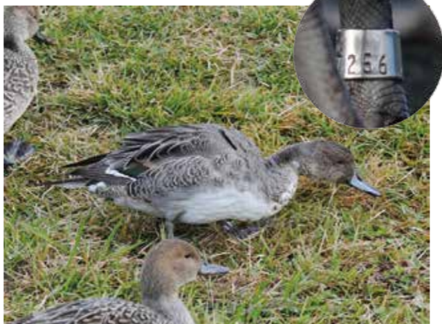
写真2. 手賀沼親水広場で2013年11月に足環番号が撮影されたオナガガモ。埼玉県越谷市で2000年に標識されたもので、少なくとも約13年生きていることがわかりました。