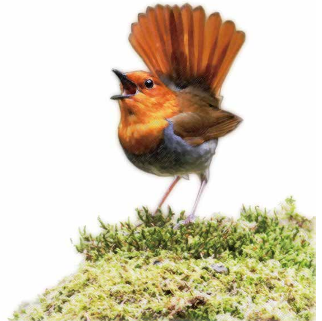
表紙の鳥 コマドリ