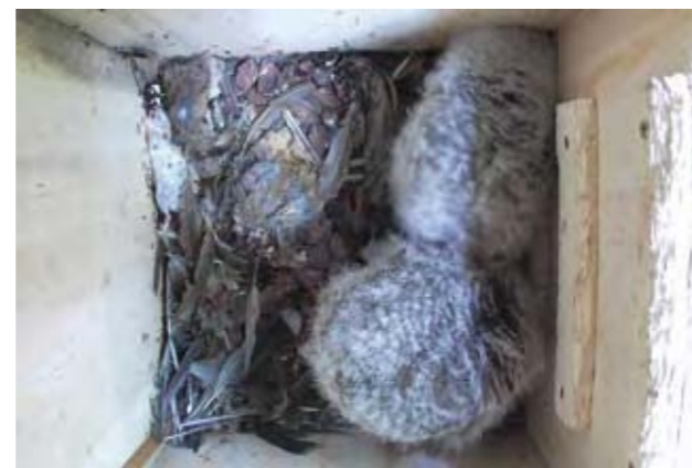
繁殖中の巣箱の様子 (鳥類の羽毛が散らばっている)