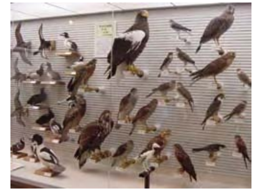
過去の日本の鳥展の様子