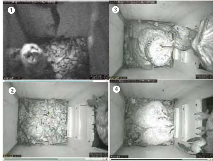
給餌の様子 (①ヤモリ ②アカネズミ ③ヒヨドリ ④ツバメ)

ヒナの孵化後しばらくはメスが巣箱内にとどまり、ヒナの世話をしますが、ヒナが体温調節できるようになると、メスも外に出て餌を探すようになります。抱卵を確認してから約2ヶ月後の5月19日に2羽とも無事巣立ちました。