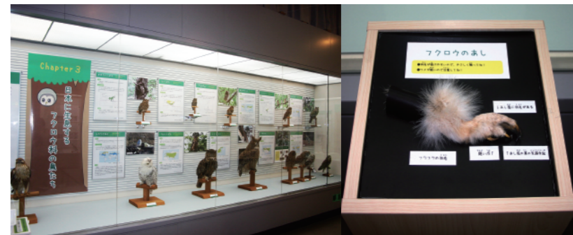
企画展示室の様子