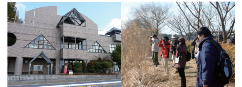
休館期間中も自然観察会「てがたん」は通常通り実施します

鳥の博物館は開館25年を経過し、様々な設備の更新が必要な時期となってきました。このたび、空調設備更新工事のため、平成28年11月7日から平成29年1月31日までの予定で休館します。自然観察会「てがたん」は休館期間中も毎月第2土曜日の午前10時から実施します。