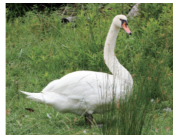
コブハクチョウ(8月)