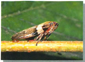
シロオビアウフキ

セミやカメムシの仲間です。幼虫は草や木の茎から汁を吸って、その排泄物（ほとんど水分）をお尻から出すときに泡立てて、その泡の中に隠れています。泡を見つけたらちょっと中をのぞいてみましょう。