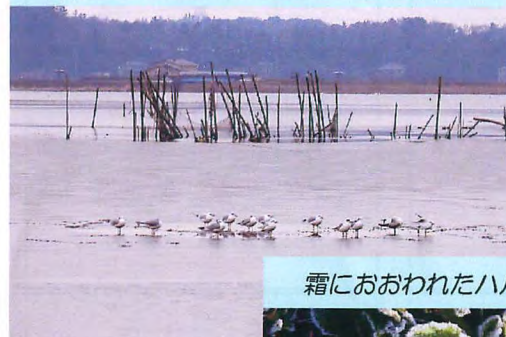
氷上で休息する手賀沼のユリカモメ