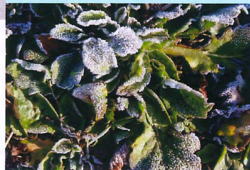
霜におおわれたハルジオンのロゼット