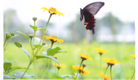
クロアゲハとイヌキクイモの花