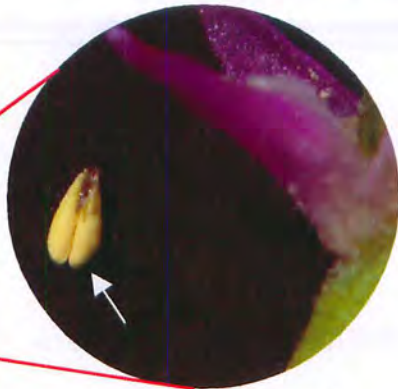
ネジバナの花粉塊