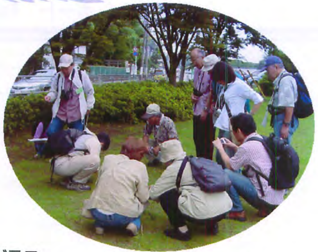
ルーペでネジバナを観察中