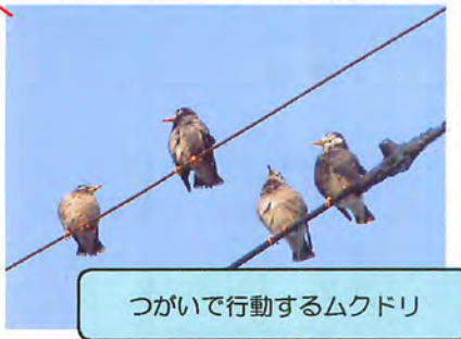
つがいで行動するムクドリ