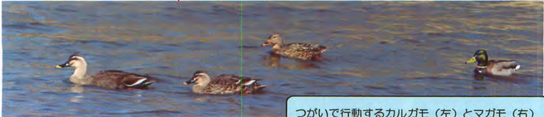
つがいで行動するカルガモ (左) とマガモ (右)