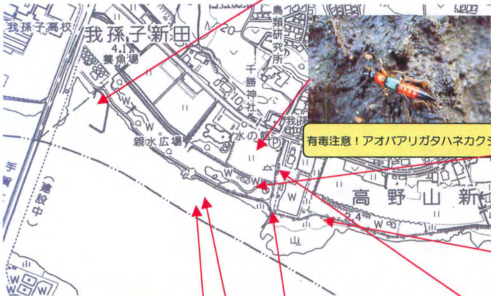
有毒注意！アオバアリガタハネカクシ