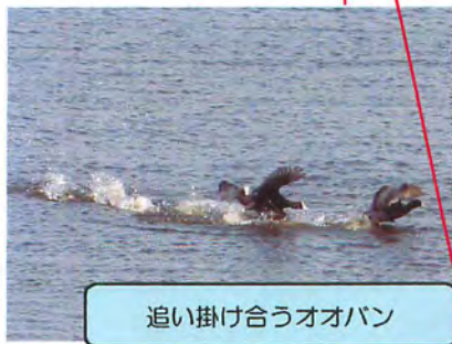
追い掛け合うオオバン