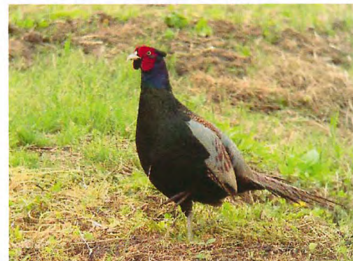
繁殖期をむかえたキジのみは手賀沼遊歩道近くでよく観察できます。