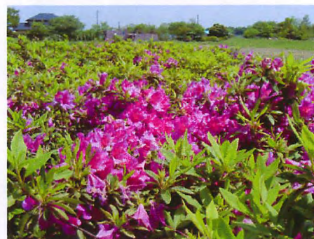
遊歩道沿いではオオムラサキツツジの花が盛り