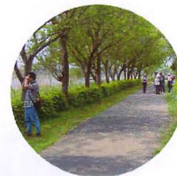
遊歩道の緑が青々としげっています