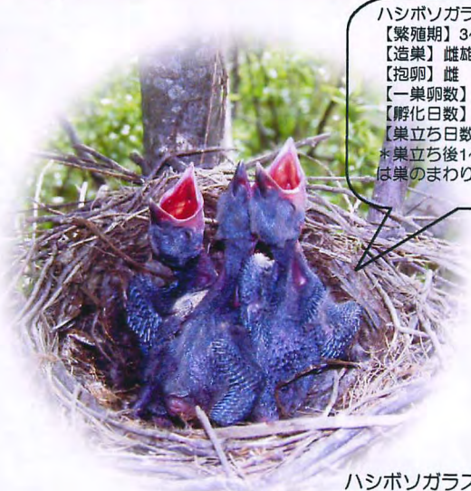
ハシボソガラスのヒナ

ハシボソガラスの繁殖生態 【繁殖期】3～6月 【造巢】雌雄共同 【抱卵】雌 【一巢卵数】3～5個 【孵化日数】20日 【巣立ち日数】30～35日 *巣立ち後1～2週間、家族は巣のまわりで過ごす