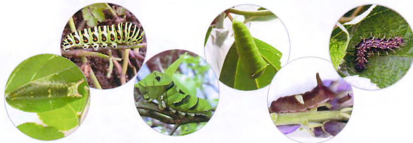
幼虫：ゴマダラチョウ キアゲハ アゲハ アオスジアゲハ ウラギンシジミ アカタテハ