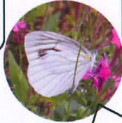
スジグロシロチョウ: