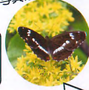
イチモンジチョウ: