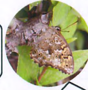
サトキマダラヒカゲ: