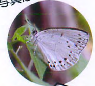
ウラゴマダラシジミ: