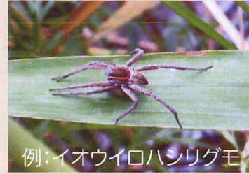
例: イオウイロハンリグモ

水辺でよく見られるクモで、成体は網を張らず、歩きながら餌を探す。写真は卵のうを運んでいる様子。