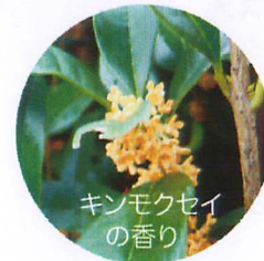
キンモクセイの香り