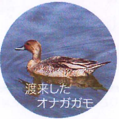
渡来したオナガガモ