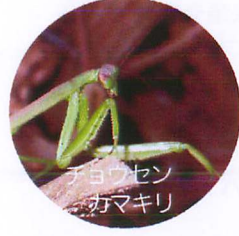
チヨウセンカマキリ