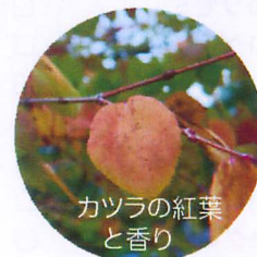
カツラの紅葉と香り