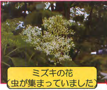
ミズキの花 (虫が集まっていた)