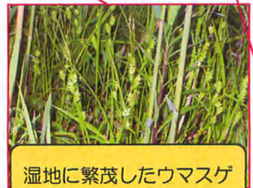
湿地に繁茂したウマスゲ