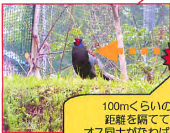
100mくらいの 距離を隔てて オス同士がなわばりを 主張していました