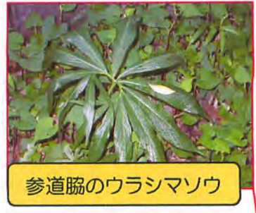
参道脇のウラシマソウ