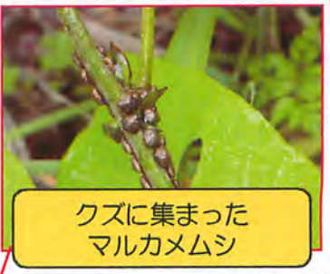
クズに集まった マルカメムシ