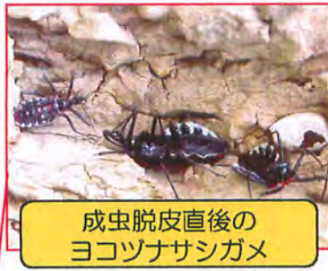
成虫脱皮直後の ヨコツナサシガメ