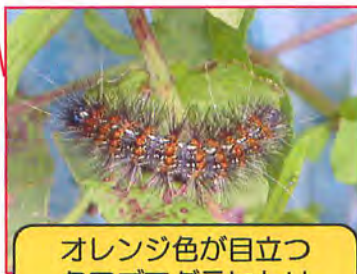
オレンジ色が目立つ クワゴマダラヒトリ (蛾)の幼虫