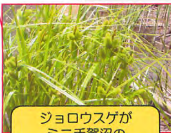
ジョロウスゲが ミニ手賀沼の 水辺に繁茂