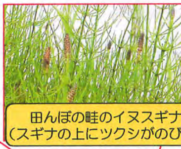
田んぼの畦のイヌスギナ (スギナの上にツクシがのびる)