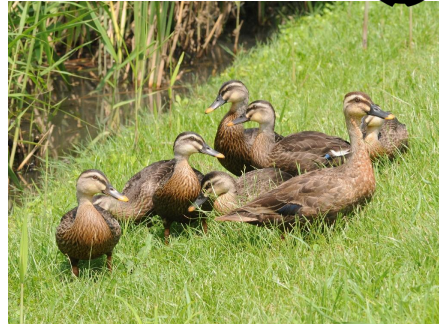
▲成長したヒナを連れたカルガモの雌成鳥（右手前）。 カルガモは手賀沼周辺で繁殖する唯一のカモのなかまです。

カモのなかまは最も身近に見られる水鳥で、自然観察の入門にはぴったりです。今回は、1年中見られるカモであるカルガモの生態やくらしぶりについて掘り下げて観察してみましょう。