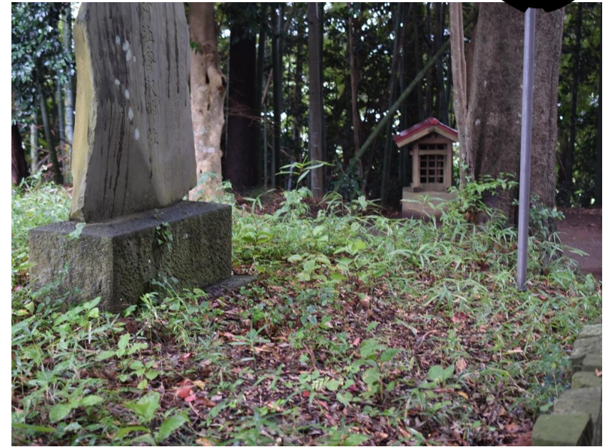
▲神社の林床。いろいろな生き物の一部が落ちています。

地面の上に落ちていたものといえば、何を思い浮かべられるでしょうか。上の写真にも沢山の落ち葉が写っています。地面の上には、死んでしまった生き物や、体の一部や排せつしたものが落ちています。