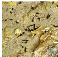
アズマヒキガエルの オタマジャクシ