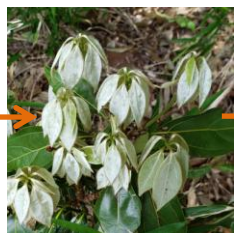
白くてふわふわした シロダモの葉っぱ