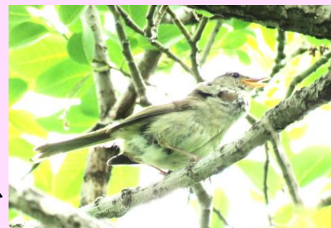
さえずるウグイスの雄

この鳥のさえずりは春を告げるものとして、サクラの開花とともに、日本人に広く親しまれてきました。気象庁はサクラの開花前線と同様に「ウグイスの初鳴き前線」も発表しており、関東では2月の下旬頃から聞かれるようになります。ウグイスは、メスよりオスの方が体が大きく（メス：体重10.0-13.7g、オス：体重14.8-22.3g）、一夫多妻で、交尾をした後も、オスは別のメスとつがうためにさえずり続けます。さえずりの聞かれる時期が終わるのは遅く、手賀沼周辺では8月になってもまだ聞かれます。