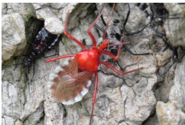
⑦脱皮直後の、体が黒くなる前のヨコヅナサシガメ。