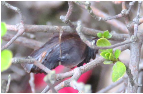
②ジャコウアゲハのさなぎ。