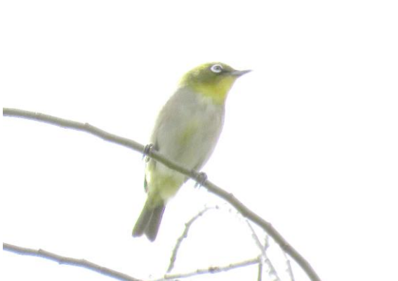
④木のとっぺんでさえずっていたメジロ。