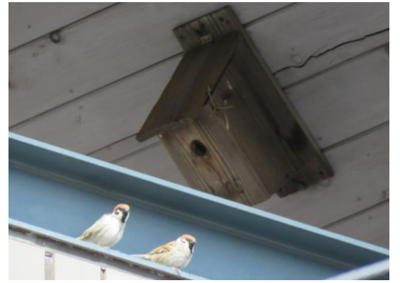
③鳥博3階にとまっていたスズメのつがい。