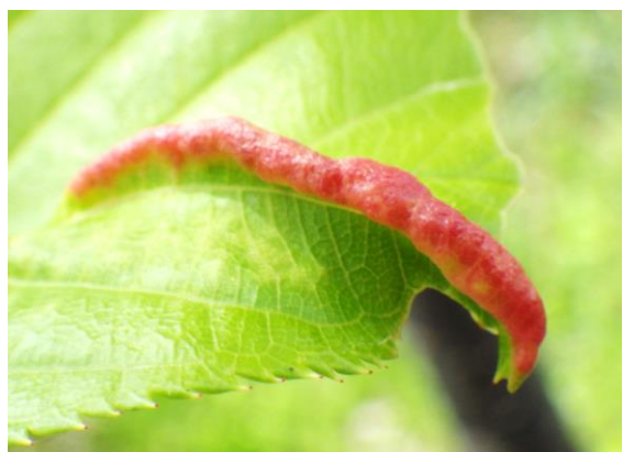
⑥サクラフシアブラムシによる虫こぶ。