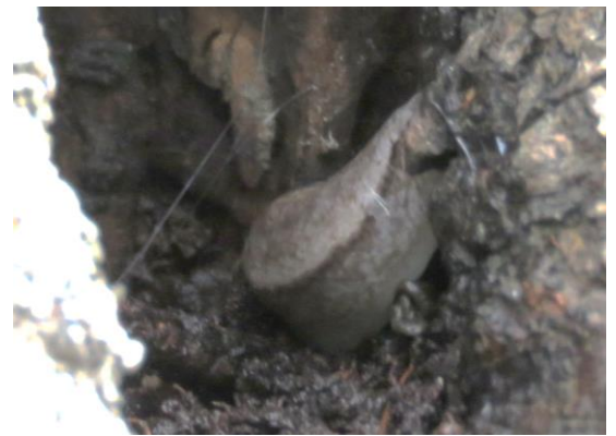
⑤木のうろにひそむナメクジ。