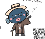
我孫子市マスコットキャラクター「手賀沼のうなぎさん」