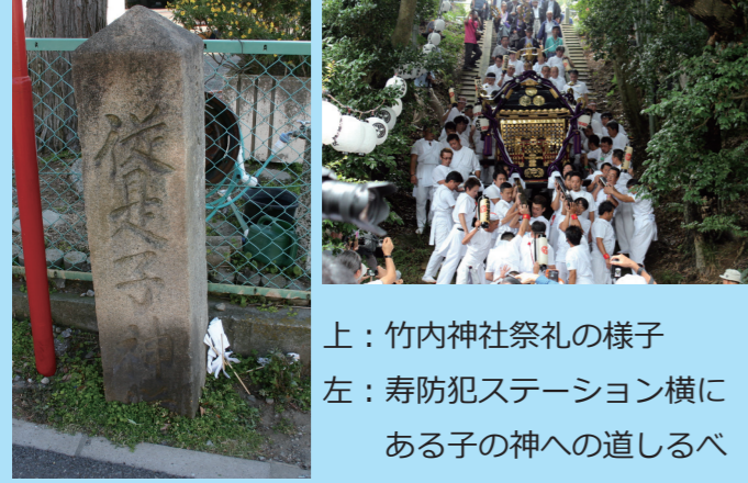
上：竹内神社祭礼の様子 左：寿防犯ステーション横にある子の神への道しるべ