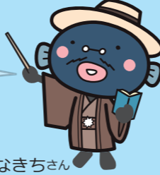
手賀沼のうなきちゃん