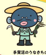
手賀沼のうなぎさん