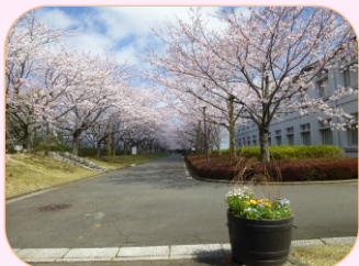
3 川村学園女子大学