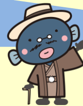
手賀沼のうなぎちゃん