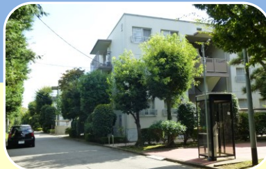
7 白山グリーンタウン