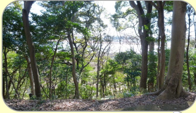
12 根戸船戸緑地から見える手賀沼