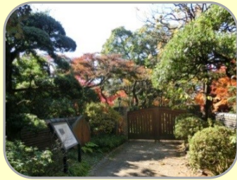
11 旧武者小路実篤邸跡