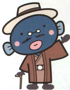
手賀沼のうなぎちゃん

我孫子市では子育てと就労の両立を支援するために、病気回復期には至らないが当面症状の急変は認められないお子さん（病児）、または病気回復期にあるお子さん（病後児）を、医療機関内にある病児・病後児保育室で一時的にお預かりする、デイサービス事業を実施しています。