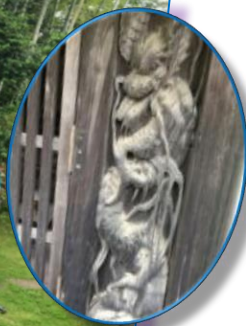
龍の舌のあかんべー