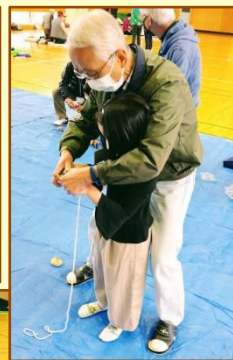
童心に還って一緒に楽しんでしまいました。