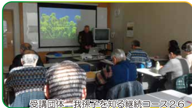
受講団体 我孫子を知る継続コース26

生涯学習出前講座の市民講師メニューは、様々な分野で知識・経験・技術をお持ちの市民の方が、ボランティアで講師を務める講座で、130講座以上あります。生涯学習のきっかけづくりとして、是非ご利用ください！