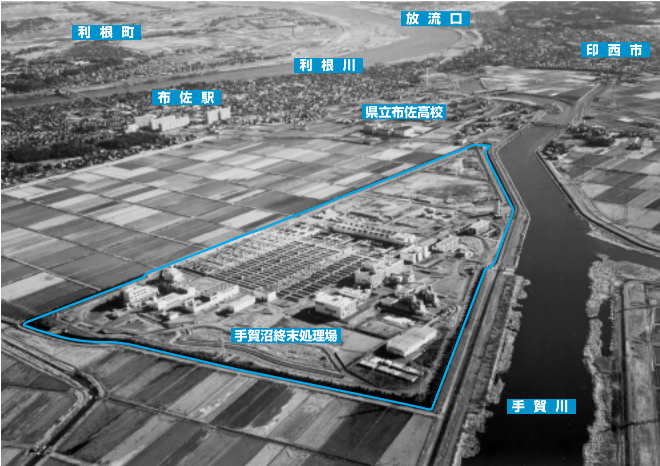
手賀沼終末処理場全景写真

我孫子市役所 建設部 下水道課 〒270-1192 我孫子市我孫子1858 TEL 04 (7185) 1111