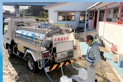
▲被災地での応急給水活動