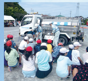
▲我孫子市総合防災訓練