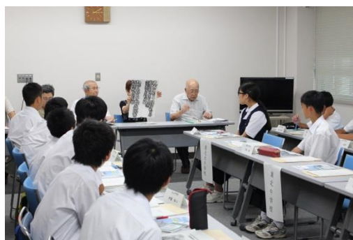
被爆体験講話の様子