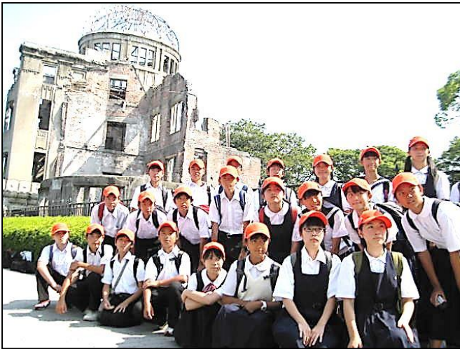
原爆ドーム前にて