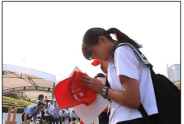
慰霊碑前にて（献花）