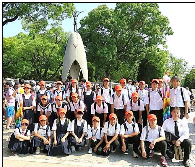
原爆の子の像前にて