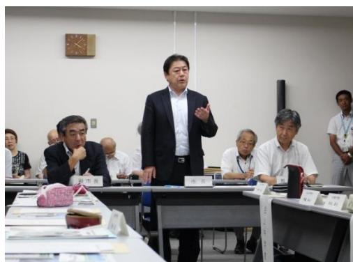
市長から激励の言葉