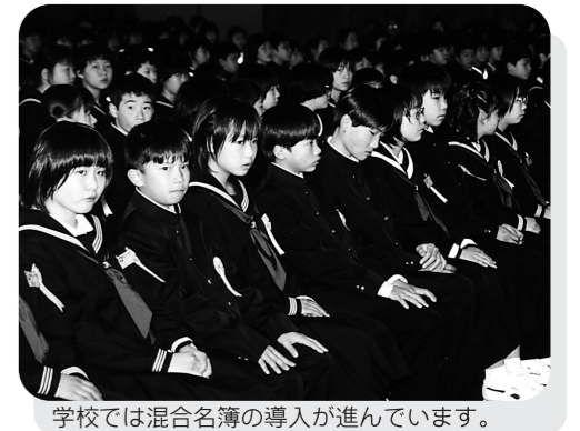
学校では混合名簿の導入が進んでいます。