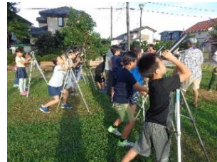
My 望遠鏡で月を見よう！

土曜日や夏休みにやっている、楽しく学べる体験型講座。科学、料理、工作、卓球、書道など、もりだくさん。