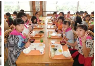
みんなで朝ごはん