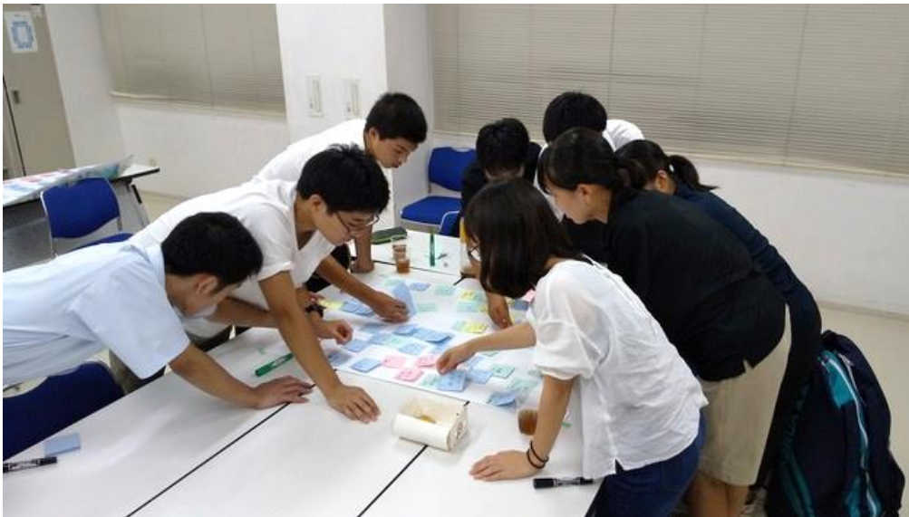
我孫子市の「良いところ」「悪いところ」を付せん書き出して分類