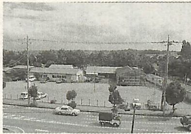
生涯学習複合施設の建設予定地

市では、平成13年度オープンをめざし中央公民館の隣接地に、図書館・公民館などからなる生涯学習複合施設(延べ床面積約4000平方メートル)の建設を計画しています。この計画策定にあたり、市民の皆さんの意見を反映させるため、建設懇談会委員を募集します。 また、同施設の建設についてご意見・ご要望がございましたらお寄せください。 ▼募集定員 3人 ▼応募資格 市内在住、在勤の方(他の審議会委員に委嘱されている方を除く) ▼選考方法 選考委員会によるレポート審査 ▼懇談会の開催回数 月1回程度(平日昼間に開催)