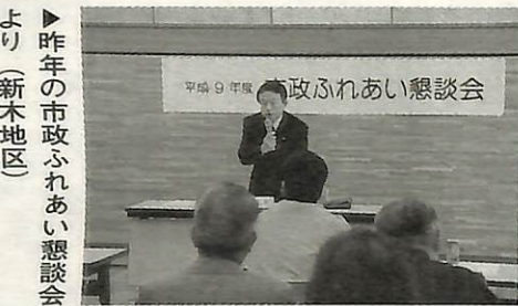
昨年の市政ふれあい懇談会より(新木地区)

れからのまちづくりを生かしてください。多くの皆さんの参加をお待ちしています。 ▼日時・場所 左表参照 ▼問い合わせ 広報広聴課(85)1111