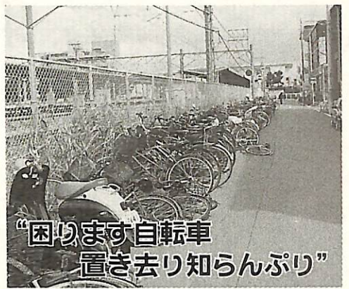
「困ります自転車置き去り知らんぷり」

市では、10月1日(木)から11月30日(月)まで、困ります自転車置き去り知らんぷりを合言葉に「駅前放置自転車クリーンキャンペーン」を行います。 駅前道路や歩道に放置された自転車は、お年寄りやからだの不自由な方の通行を妨げるばかりか、災害の際には避難や救助活動の障害にもなりかねません。「チョットだけだから大丈夫」といった軽い気持ちで、多くの放置自転車を生む原因です。 我孫子駅・天王台駅周辺に設置された自転車駐留場は、利用台数に十分対応できず、市営の有料自転車駐留場が満杯になっています。 市では、今後も放置自転車がなくなるよう、できる限り撤去作業を強力に進めていきますので、放置自転車をなくし安全で快適な街となるよう、市民の皆さんの協力をお願いします。 ▼問い合わせ 交通整備課(85)1111内線330