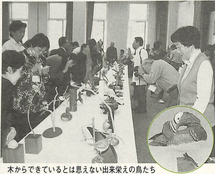
木からできているとは思えない出来栄の鳥たち

昨年、設立総会と作品展を我孫子市などで開催した日本バードカービング協会が、今年も市民会館を中心に「全日本バードカービングフェスティバル'98」を開催します。