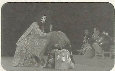
古戸地区に約280年前から伝わる里神楽を伝承する