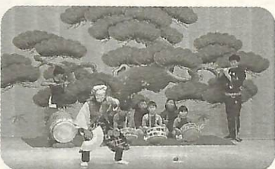
笛・太鼓によるお囃子を存続させている

※民俗芸能の皆さんのほかにも、ひよつとご睦の指導を受けている、布佐中学校郷土芸能クラブの生徒たちが出演し、日頃の練習成果を披露します。 演目：「仁羽囃子」「投げ合い」 ▼問い合わせ 教育委員会社会教育課(85)1151