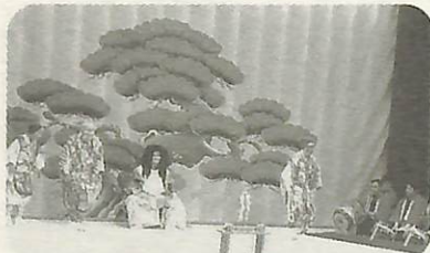
布佐竹内神社の祭礼で里神楽やお囃子を演じている