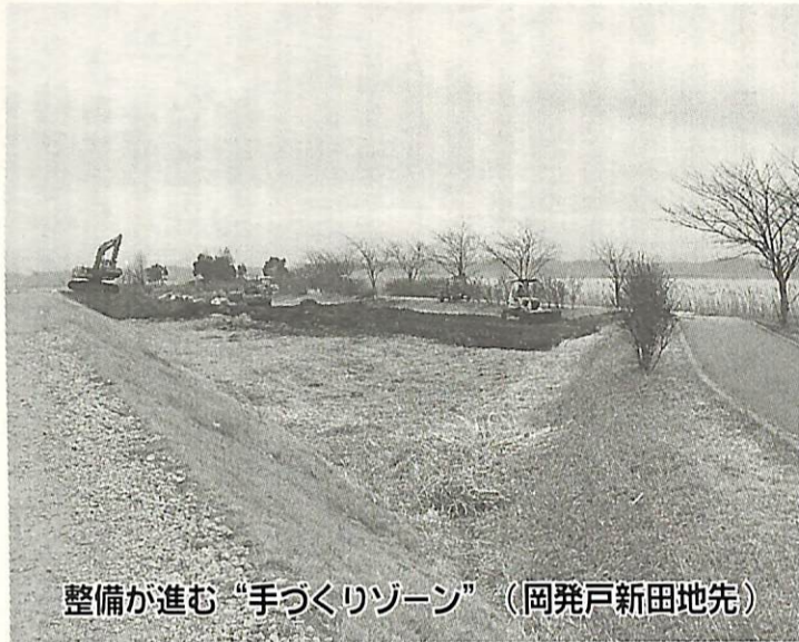
整備が進む「手づくりゾーン」(岡発戸新田地先)

市では、地域振興券を取り扱う商店(特定事業者)を募集します。 ▼対象事業者 我孫子市内に店舗、事務所があり、小売業・飲食業・洗濯・理美容・旅館・医療の各種サービス業・運輸・通信業(旅行業を含む)等を営む事業者 ▼申請期間 2月1日(月)から2月26日(金)まで(土曜・日曜日、祝日を除く)午前9時から午後5時 ▼申請方法・受付場所 特定事業者登録申込書(商工会、市役所本庁市民課窓口、各支所に用意)に必要事項を明記し、我孫子市商工会(寿1の13の27)へ直接持参 ※特定事業者になれる事業者 ①出資や債務の支払い ②有価証券、商品券、プリペイドカード、切手、官製はがきなど換金性の高いもの ③国や地方公共団体への支払い(会館使用料、水道料金、公営ギャンブル、宝くじなど) ④公共サービスに準じる電気料、ガス料金・NHK受信料など ▼《換金方法》 特定事業者は、地域振興券換金請求書に必要事項を記載し、地域振興券と特定事業者登録証明書添えて、市が指定した金融機関に提出してください。 ▼問い合わせ 地域振興券推進本部 ☎(85)1111 内線379、または我孫子市商工会 ☎(82)3131