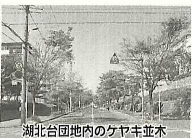
湖北台内地域のケヤキ並木

市内には、約2000本の道路があります。 日頃何気なく歩いている道ですが、その道の多くには名前がついていません。昔は使われていた歴史を感じさせる名称も、時の流れとともに消えてしまったものもあります。 ご存じの方は、ぜひ商工会にご連絡ください。 皆さんのご協力をお願いします。 ▼受付期間 3月31日(水)まで ▼連絡先・問い合わせ 商工会 ☎(82)3131、ファクス ☎(82)1900