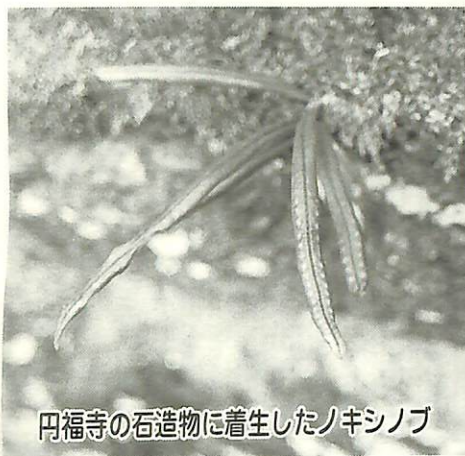
円福寺の石造物に着生したノキシノブ

譲ってください!! *14インチ自転車(補助付き) (井出(83)3139) 申し込み 連絡先に直接電話してください。なお、コーナーへの掲載申し込みは、電話で商工観光消費指導係へ連絡してください。 コーナー利用上の注意 取り扱う品物は、家具、台所用品、電気製品、子ども用品、学習器具など、主として日用雑貨等の耐久消費財です。衣類、自動車、生き物は取り扱いません。 問い合わせ 商工観光課消費指導係・内線329