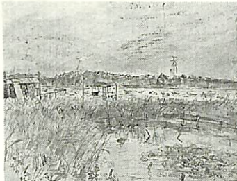
▲「手賀沼の夕焼け」(水彩)