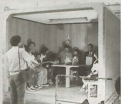
▲「大地震」を体験しよう

日時 10月27日(土)午前10時から午後4時(雨天実施・入場無料) 場所 電力中央研究所我孫子研究所 内容 体験!20世紀の大地震、大地の熱で発電、講演会「私たちの暮らしと環境ホルモン」、波と遊ぼう、のぞいてみよう!ミクロの世界、電池をつくろう!、大きなシャボン玉づくり、手賀沼研究紹介コーナー、模擬店 ほか 無料送迎バス ①我孫子駅南口から…午前10時から15分間隔 ②ふれ愛フェスタ会場から…1時間に1本程度 ※車での来場はご遠慮ください。 問い合わせ (財)電力中央研究所事務部 ☎(82)1181