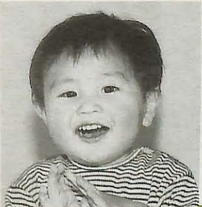
(布佐平和台・1歳3カ月)