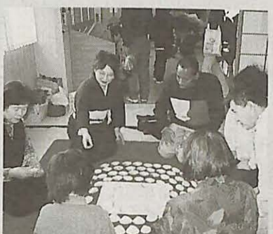
▲「平安貝あわせ」に挑戦