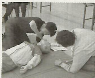
▲救急隊員が指導します

到着するまでの間にケガ人や病気の人を救う技術を学んでみませんか。 日時・場所 5月19日(日)午前9時から正午、消防本部 対象・定員 市内在住か在勤で健康な方、先着30人 内容 一人法の心肺蘇生法、大出血時の止血法の指導 講習時間 3時間(講習後、救命技能適正と認められた方には修了証を交付) 費用 無料 申し込み・図 電話または直接 消防本部警防課 ☎7181-1770(1)(休日・夜間は ☎7184-0119)へ