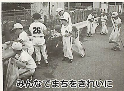
みんなでまちをきれいに

放置しておくと、鳥がからんで動けなくなり死んでしまうこともあります。釣り場はみんなのもので、ルールを守って楽しみましょう。6月2日 ゴミゼロ運動にご協力を。今年のゴミゼロ運動は、6月7-10日