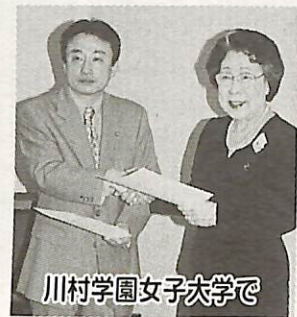
川村学園女子大学で

図書館資料の相互利用について、市は4月17日に中央学院大学と川村学園女子大学の両大学と協定を結びました(写真)。 今後は、市民図書館に利用登録している市内在住の高校生以上の方は、両大学の資料を市民図書館を通じて利用できます。 利用は、両大学のホームページで検索し、希望する資料が市民図書館へ出向いて利用します。 川村学園女子大学の資料は、市民図書館に取り寄せて、館内で閲覧することになります。 詳しくは、市民図書館☎7184-1110へお問い合わせください。