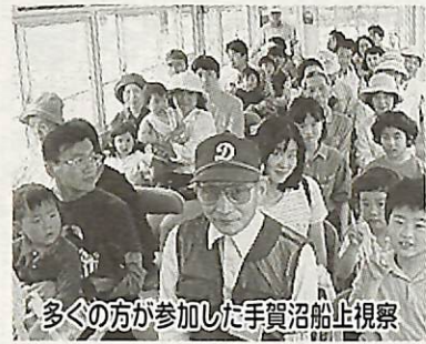
多くの方が参加した手賀沼船止視察

手賀沼のほとりで楽しく一日を過ごしながら、ふるさと手賀沼を感じてみませんか。 日時 5月12日(日)午前9時から午後3時(雨天実施) 場所 手賀沼親水広場