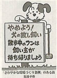
「さわやかな環境づくり条例」のある街 我孫子市

道路、公園、農地などへの犬のフンの放置は他の人に迷惑となり、不快感を与えます。「さわやかな環境づくり条例」では、飼い犬のフンを持ち帰ることを義務づけています。飼い主の皆さん、犬を屋外で散歩させるときは、マナーを守ってください。