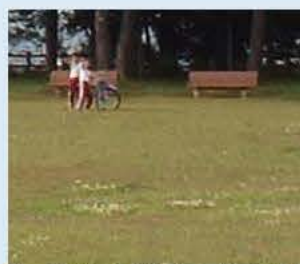
ベンチが設置された気象台記念公園

昨年度は、145万175円の募金が寄せられました。また、これまでの積立額のうち、9300万円を手賀沼