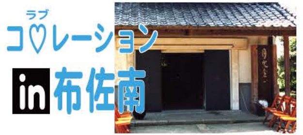
パイオリンコンサートが行われる月光倉

で、ハーフマラソンを2時間30分以内で完走できる方 定員 先着7000人（参加費振込日付順） 参加費 3500円 大会要項配布場所 市役所本庁各支所・行政連絡所、教育委員会、市民体育館 申し込み 大会要項に添付の振替用紙に必要事項を明記し、Cランテス（コンビニ、クレジットカードでの支払い）の場合は7月25日（必着）、郵便振替の場合は7月31日（消印有効）までに参加費を振り込み 手賀沼エコマラソンエントリーセンター ☎03・3714・7924（平日の午前10時から午後5時）