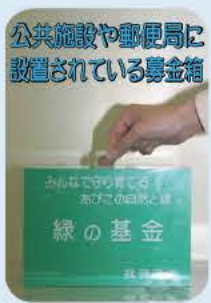
公共施設や郵便局に設置されている募金箱

沿いの斜面林、中峠亀田谷公園の用地確保や気象台記念公園の整備費の一部として活用しました。 平成14年度末現在の残高は、1億8900万円です。 「緑の基金」募金箱は、市内の公共施設や郵便局に設置してあります。今後も、皆さんのご協力をお願いします。 公園緑地課・内線545