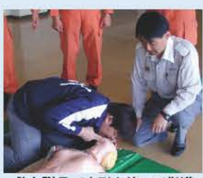
救急隊員が人形を使って指導

消防署では、バイスタンダー(その場に居合わせた応急処置のできる人)を育成するため、普通救命講習会を開催します。 救急隊員が人形を使って、人工呼吸や心臓マッサージ、止血法を指導します。 日時 7月5日(土)午前9時から正午 場所 布佐南近隣センター(参加無料) 対象・定員 市内在住・在勤で健康な方、先着30人 内容 一人法の心肺蘇生法、大出血時の止血法の指導 ※講習後、救命技能適正と認められた方には修了証を交付します。 申し込み・☎ 直接または電話で6月25日までに、消防本部警防課☎7181-7701(土・日・祝日と夜間は☎7184-0119)へ