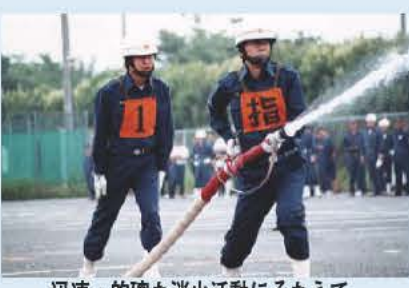
迅速・的確な消火活動にそなえて

操法大会は、市内21の消防分団が日ごろの鍛錬の成果を発揮する場です。 各分団は、「いざ火災」という時に迅速かつ的確に消火活動が行えるよう、消防資機材の操作や的確な動作などを訓練しています。大会では、その正確さや時間を競います。 地域防災の担い手である消防団のきびきびとした動きを、ぜひ一度ご覧ください。(観覧無料) なお、この大会で優勝した分団には、東葛飾支部大会をへて県大会、全国大会への道が開かれています。 日時・場所 6月22日(日)午前8時から正午、NEC我孫子事業場駐車場(雨天実施) ☎ 消防本部警防課☎7181-7701(当日は☎7184-0119)