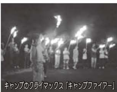
キャンプのクライマックス「キャンプファイア」

竹炭を、竹の切り出しから、窯入れ、窯出しまで、自分の手で作ってみませんか。ふれあいキャンプ場で竹細工や竹を利用した料理など、竹づくしの宿泊キャンプも行います。 日時・内容 7月26日(土)午後1時45分市役所集合、27日(日)午前