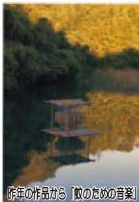
昨年の作品から「蚊のための音楽」

英語通訳などのライフサポーター*会場設営、受付、会場案内、作品制作助手などのイベントサポーター ◎一般制作参加者 心地よい森の中で、自由に自分を表現してみませんか 実施時期 11月9日(日)から15日(土)：作家受け入れ・制作準備期間、16日(日)から22日(土)：公開制作期間、23日(日)から12月7日(日)：完成作品展示期間 場所 布佐市民の森、相島の森、相島倉ギャラリー、宮ノ森公園、布佐下多目的広場 主催 我孫子野外美術展実行委員会 申し込み・電話、ファックス、Eメールのいずれかで櫻庭 FAX 7189-10324 Eメール aoe103@hotmail.com