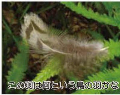
この羽は何という鳥の羽かな

一枚の羽毛から 鳥の世界をのぞいてみよう 鳥の博物館企画展「羽毛のふしぎ」開催中 鳥の羽 ④私の羽コレクション ⑤羽を集めて整理しよう に沿って鳥の羽毛を紹介。身近な鳥の羽毛パネルや、私の羽コレクションなど見どころたくさんの内容になっています。 この企画展に合わせ、体験学習室内に「羽で遊ぼう」コーナーを設置しました。ニワトリの羽毛を使った工作や実験を楽しむことができます。ぜひ、ご来館ください。 開催期間 9月28日(日)まで 開館時間 午前9時30分から午後4時30分 休館日 月曜日(祝日等の場合は開館し、その翌日に休館) ☎ 鳥の博物館 ☎ 7185-2212