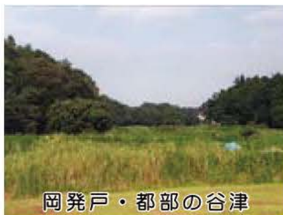
岡発戸・都部の谷津

岡発戸・都部の谷津の風景や、そこに生息する生物などを被写体とした写真を募集します。 ご応募いただいた作品は、8月28日から市民プラザで開催する写真展に展示します。 テーマ 岡発戸・都部の谷津の風景・生物・植物など ※谷津内の土地は私有地です。稲の作付け等も行っていませんので絶対に立ち入らないでください。撮影はハケの道(山際の道)から行ってください。