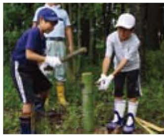
▲竹割りも自分の手で

場所 国立磐梯青年の家(福島県) 対象・定員 市内在住の小学校4年生から中学校3年生、先着80人 参加費 1万5000円 共催 我孫子市青少年相談員連絡協議会、我孫子市教育委員会 申し込み・電話 ハガキに住所、氏名、性別、学校名、学年、電話番号、保護者名、「青少年キャンプ参加希望」を明記し、〒270-1166我孫子1684教育委員会社会教育課☎7185-1151へ