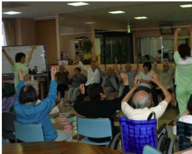
▲デイサービスでのひとこま (くおん苑通所介護事業所で)

14年度は、介護が必要かどうかを審査する介護認定審査会を82回開催し、3602件を審査判定しました。(認定期間は6カ月から1年)