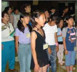
本番に向けての歌稽古

出演者は3歳から83歳まで総勢200人。土曜・日曜を中心に稽古を行い、お互いの交流を深めながら意欲的に歌、ダンス、演技などの技術を磨いています。