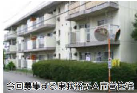
今回募集する東我孫子A市営住宅

募集内容 下表を参照 入居資格 次の①から④のすべてに該当する方 ①市内に在住・在勤の方 ②住宅に困窮している方 ③市税を滞納していない方 ④同居または同居予定の親族がある方 ※単身者は、身体障害者で1級