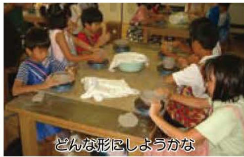
どんな形にしようかな

夏休みに、陶芸にチャレンジしてみませんか。世界にひとつしかない自分だけの焼き物を作ります。 日時・内容 7月31日(木)午前10時15分から午後3時：成形、8月1日(金)午後1時15分から4時