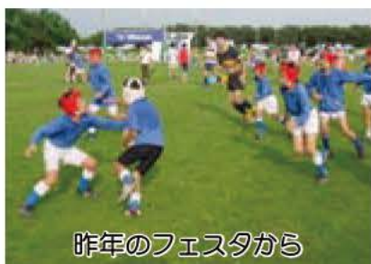
昨年のフェスタから

場所 国立磐梯青年の家(福島県) 対象・定員 市内在住の小学校4年生から中学校3年生、先着80人 参加費 1万5000円 共催 我孫子市青少年相談員連絡協議会、我孫子市教育委員会 申し込み・電話 ハガキに住所、氏名、性別、学校名、学年、電話番号、保護者名、「青少年キャンプ参加希望」を明記し、〒270-1166我孫子1684教育委員会社会教育課☎7185-1151へ