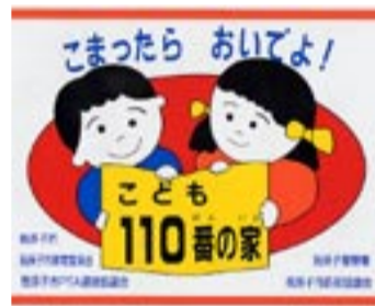
「子ども110番の家」のマーク

「子ども110番の家」としてご協力いただける方は、学区の小学校か中学校まで連絡をお願いします。 教育委員会少年センター ☎ 7185・1151