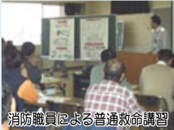
消防職員による普通救命講習

市民の皆さんに学習機会を提供する「あびこ楽校」を運営する「あびこ楽校協議会」が11月に発足。