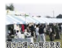
親水広場での展示発表