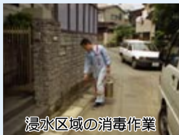
浸水区域の消毒作業

市では、排水施設17カ所の改修をはじめ、下水管の布設替え、排水機場整備などを進めています。