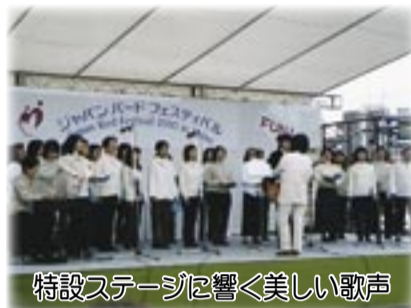
特設ステージに響く美しい歌声

11月8・9日、鳥の博物館、アピスタなど市内5つの会場で、ジャパンバードフェスティバルが開催されました。 フェスティバルには、93の団体が参加し、2日間で約4万8000人の方が来場しました。 バラエティーに富んだ内容に 今回は昨年までの内容に加え、親水広場内に特設ステージを設け、シンポジウム、トークショー