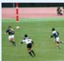
ラグビー日本選手権