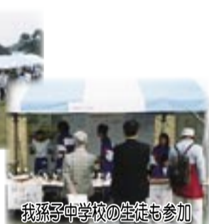
我孫子中学校の生徒も参加

自然環境の大切さを世界に発信 「来年は、さらに参加団体の拡大と内容の充実に努め、日本最大の鳥のフェスティバルとして定着させ、鳥を通じて自然環境の大切さを全国に、世界に発信していきます」と実行委員会では語っていました。