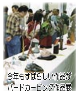
今年もすばらしい作品がバードカード展

11月8・9日、鳥の博物館、アピスタなど市内5つの会場で、ジャパンバードフェスティバルが開催されました。 フェスティバルには、93の団体が参加し、2日間で約4万8000人の方が来場しました。 バラエティーに富んだ内容に 今回は昨年までの内容に加え、親水広場内に特設ステージを設け、シンポジウム、トークショー