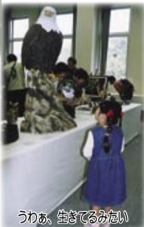
うわあ、生きてるみたい