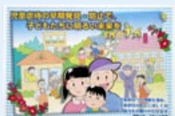
▲啓発紙を12月7日に発行

児童虐待の報道が後を絶たない中で、11月には市内でも小さな命が失われてしまいました。