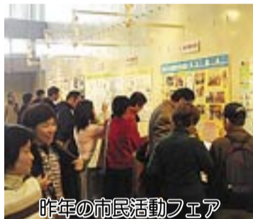
昨年の市民活動フェア

市民活動フェアinあびこ2005準備会（ボランティア・市民活動サポートセンター、我孫子市社会福祉協議会、我孫子市では、「市民活動フェアinあびこ2005」の参加団体（実行委員）と事務局スタッフを募集します。 市民活動フェアは、地域課題に取り組みボランティア活動や市民活動を多くの市民の皆さんに知っていただき、参加意識や支援者・理解者を増やすことを目的に開催しているもので、平成17年3月5日・6日にアビスタで開催する予定です。 今年度の市民活動フェアは、ボランティア・市民活動サポートセンターが中心となって開催します。興味をお持ちの団体・個人の方は説明会にご参加ください。