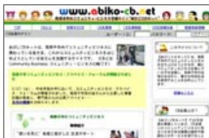
▲「あびこCBネット」のトップページ

コミュニティビジネスは、皆さんの身の回りの問題を解決するために、市民が主体となって地域に必要なサービスや物を提供する。地域にやさしいビジネスです。 「あびこCBネット」は、市内でコミュニティビジネスに携わっている方やこれからコミュニティビジネスを始めようとする方を支援するサイト（インターネット上で展開される個人や企業・法人のページ）です。 なお、このサイトは平成15年度の経済産業省「市民活動活性化モデル事業」として、今年3月に我孫子市とNPO法人コミュニティビジネスサポートセンターが共同で開設しました。 地域情報サイトも開設 市内の買い物情報やグルメ情報を集めた地域情報サイト「あびこタウンネット」も同時にオープンしました。今後、市内のコミュニティビジネスのサービ