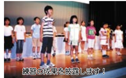
練習の成果を披露します!

※さらに、乳幼児のいる家庭ではミルク、紙おむつ、ほ乳瓶などを、障害者や高齢者のいる家庭では常備薬、つえ、介護用品なども用意しましょう。