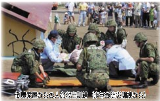
倒壊家屋からの人命救出訓練(昨年の防災訓練から)

市では8月28日、総合防災訓練を行います。今年は新木・布佐地区を中心に実施します。日頃から十分な備えをして、いざというときに適切な行動がとれるよう、皆さんでご参加ください。