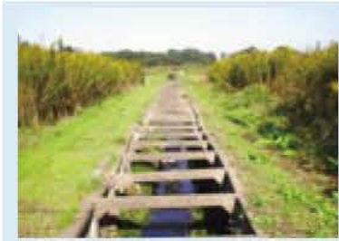
▲整備前のコンクリートの垂直護岸