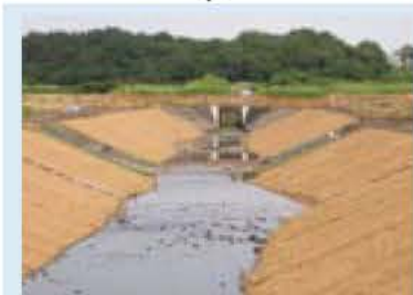
▲谷津の土で覆った緩やかな勾配の護岸