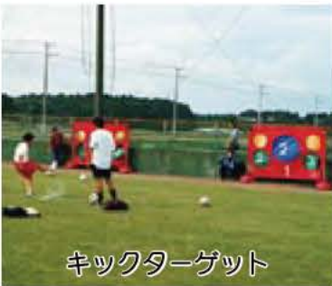
キックターゲット

鳥の写真展…10月9日(土)・10日(日)・13日(水)・20日(水)・23日(土)・27日(水)・31日(日)、11月3日(日) ①11時、②13時30分、③15時 デジスコで鳥を撮ろう…10月10日(日)・17日(日)・24日(日)・31日(日)、11月7日(日) ①10時、②13時30分 鳥風(たこ)製作実演…10月11日(祝)・19日(火) 13時30分 友の会講座「ハチクマの渡り」…10月16日(土) 13時30分 鳥を描いてみよう…10月16日(土)・30日(土) 10時(各日当日先着7人) ペーパークラフト教室…10月17日(日) ①10時、②13時30分 鳥風を作ろう…10月24日(日) 13時30分