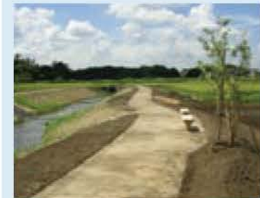
▲草が芽吹き始めた工事直後の護岸

市では、市内で最も谷津の地形と自然環境が残っている岡発戸・都部の谷津を保全・再生し、昭和30年代の農村環境の復活をめざす谷津ミュージアム事業を進めています。