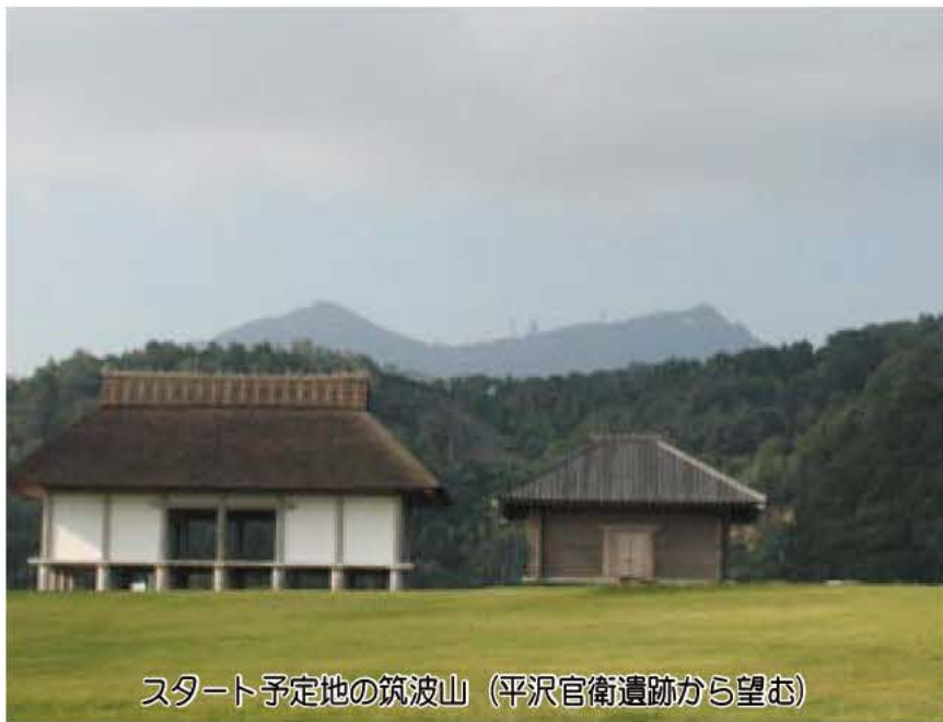
スタート予定地の筑波山 (平沢官衛遺跡から望む)

「ABIKOチャレンジ・ウォーク」は、子どもたちが6〜7人のグループでキャンプをしながらゴールをめざす体験活動で、今年度からスタートした「我孫子子ども総合計画」の中の事業です。子ども総合計画推進本部(本部長・福島市長)では、市民も加わった実行委員会を作り、来年8月の実施に向けて準備を進めていきます。