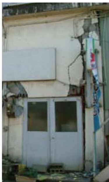
▲新潟県中越地震で被害をうけた建物