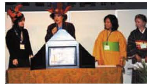
▲昨年の英語の紙芝居

来年8月に上演する「バレンタイン・ドリーム」の内容説明会を行います。 日時・場所 12月23日(祝)午後2時から4時、市民会館 内容 ◎ストーリーの説明 ◎スタッフ(演出、音楽、振り付け)の紹介 ◎テーマ曲の紹介 対象 市内在住・在勤・在学中または我孫子にかかわりのある方で公演時点で小学校1年生以上 申し込み 不要 主催・☎ 教育委員会文化課 ☎7185・1601