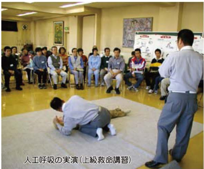
人工呼吸の実演(上級救命講習)

「あびこ楽校協議会」は公募市民、学識経験者、学校・企業・民間教育事業関係者、市職員で構成し、「あびこ楽校」の運営や学習事業の総合調整、情報提供、指導者の養成などを行います。