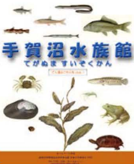
▲「手賀沼水族館」のトップページ市のホームページからご覧になれます。アドレスは、 http://www.city.abiko.chiba.jp です。