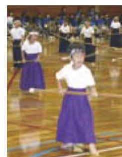
▲園児のなぎなた演技で歓迎