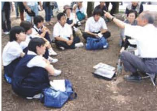
▲被爆体験者の話に耳を傾ける生徒

式典への参列のほか、平和公園への千羽鶴の献納や灯笼流しの体験、被爆体験証言グループの方から原子爆弾投下時の様子やその後の復興の様子などを聞きました。