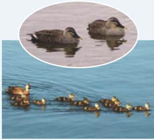
文 村松 和行(鳥の博物館)

カルガモは、日本のどこでも見られるカモの仲間です。本州より南では、1年を通して観察できます。雑食性ですが、主に穀類を好んで食べます。繁殖期は4月から7月までで、水辺近くの草む