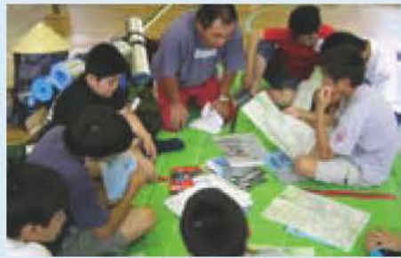
▲コース選びの真っ最中

「ABIKOチャレンジ・ウォーク2005」が8月23日から28日まで実施されます。小学5年生から高校1年生の男女26人が、4つのグループに分かれ、筑波山の麓から