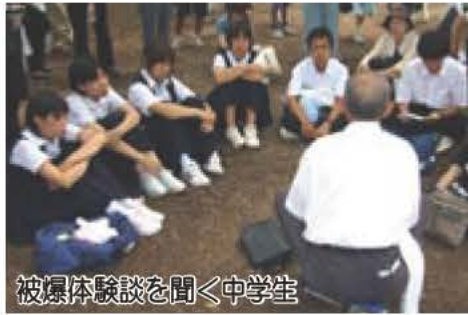
被爆体験談を聞く中学生

第1部では、8月6日の広島市の平和記念式典に出席した中学生が、原爆投下の地で学んだこと、感じたことを発表します。