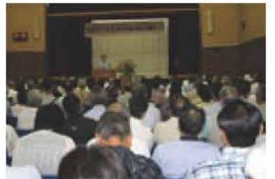
▲大勢の市民が参加したシニア世代歓迎の集い (7月17日)

から応募がありました。今回は、インターン（体験者）希望者を募集します。 シニアの皆さん、地域活動を知るきっかけに、ぜひご参加ください。 インターンシップ実施期間 9月中旬から12月中旬 ※06年2月には、報告会を予定しています。 参加費 無料（ただし体験内容によっては、実費がかかる場合があります）