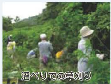
沼ベリでの草刈り

kuchi@city.abiko.chiba.jp へ(集合場所などをお知らせします)