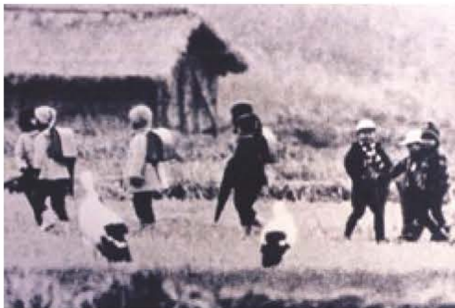
▲40年前日本のコウノトリは人里にすむ身近な鳥だった

は、人里近 な湿地をすみか としていたので 大陸のコウノト リのように広大 な湿地をすみか としていたので は、人里近