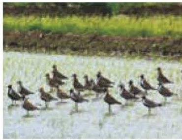
▲田んぼに集まったムナグロ