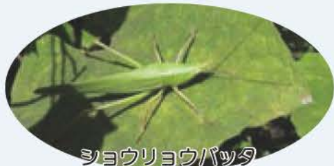
シヨウリョウバッタ

参加費 無料 持参 帽子、水筒、筆記用具 主催 鳥の博物館 申し込み・☎ 電話で鳥の博物館 ☎ 7185-2212へ