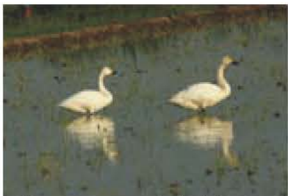
▲北新田にコハクチョウが飛来 (04年10月22日)

カモ類やタゲリやタシギなど冬鳥たちが集まります。これをねらってハヤブサ、オオタカなど猛禽類も姿を現します。時には、ハクチョウもやって来ます。昨年は、コウノトリが約120年ぶりに我孫子に舞い降りしました。