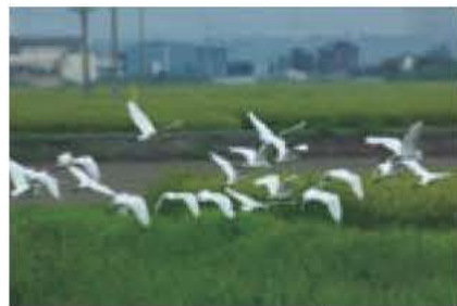
▲アマサギとチュウサギの群れ

稲刈りの始まった田んぼは、赤トンボの群れでいっぱい。子育てを終えたチュウサギやアマサギの群れも集まります。コンバインの後を追いかけて、飛び出すバツタを食べるアマサギの姿も見かけます。