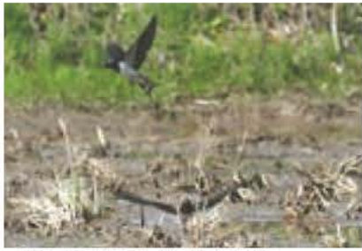
▲田んぼの水面近くを飛びツバメ