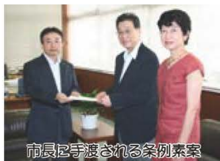
市長に手渡される条例素案

国勢調査が、10月1日に全国一斉に行われます。国勢調査は、統計法に基づいて行われる人口・世帯などについての基本的な統計調査で、日本に住んでいるすべての方が対象となります。 9月下旬から10月上旬にかけて、総務大臣から任命された調査員（調査員証を携帯）が、調査票の配布と受け取りに伺います。 調査の結果は、少子高齢社会への取り組みやまちづくりに生かされます。 なお、調査員をはじめとする調査関係者には、守秘義務があり、調査内容の秘密は保護されます。 皆さんのご協力をお願いします。 総務課・内線379