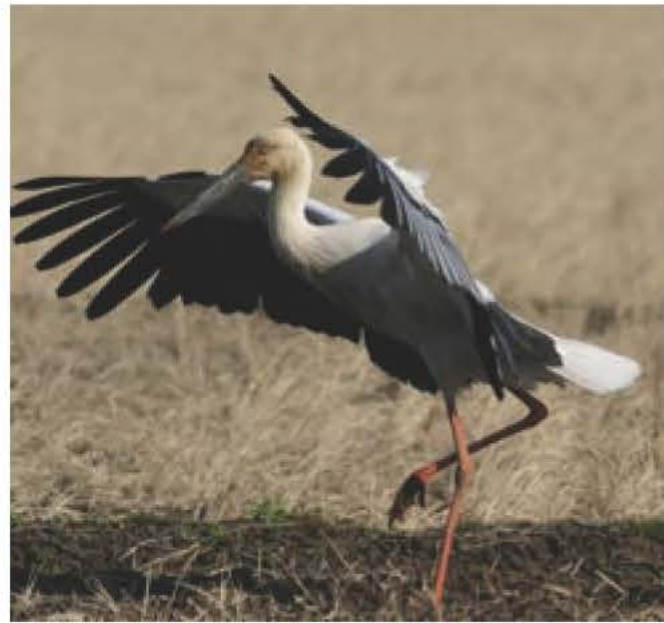
▲北新田に舞い降りたコウノトリ (04年12月25日)