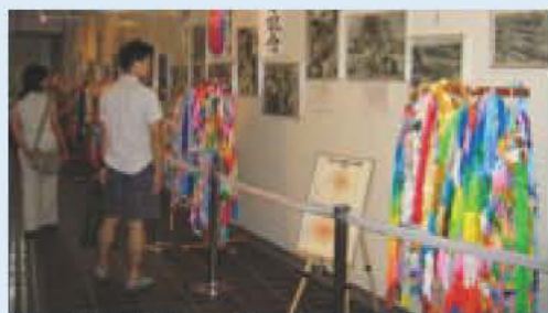
▲アピスタストリートでの展示

被爆60周年にあたり、市と我孫子市原爆被爆者の会との協働の取り組みとして市民の皆さん