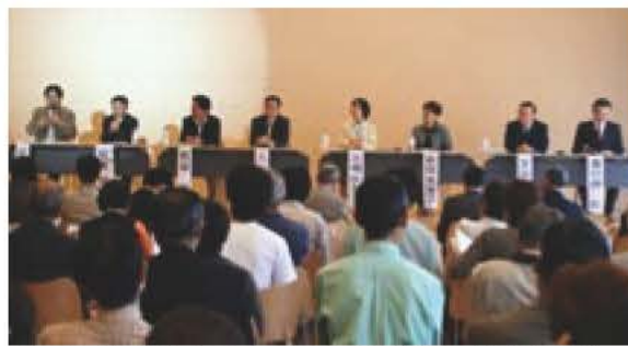
▲シンポジウムには大勢の市民が参加 (10月23日)