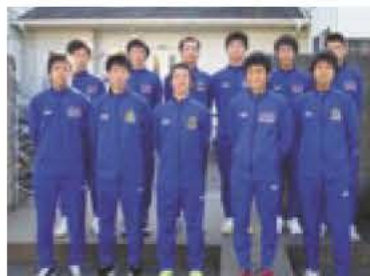
▲中央学院大学陸上競技部

「あびこ楽校」は、市役所の各課が行うさまざまな生涯学習事業を体系化して、市民のみなさんに提供します。市の生涯学習推進本部のもとに置かれ、運営は市民を中心に、学識経験者や学校、企業、民間教育機関の関係者、市職員などで構成される「あびこ楽校協議会」が行っています。