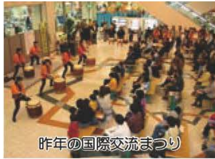
昨年の国際交流まつり

「国際交流」世界の神話をのぞいてみよう」をテーマに「第14回あびこ国際交流まつり」を行います。