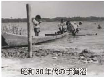
昭和30年代の手賀沼

手賀沼には、昭和30年代前半まで、カラスガイがたくさん生息していました。昔から手賀沼で貸し舟業を営