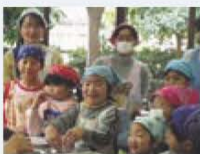
▲子ども食クラブの様子

氏名、電話番号を明記し、11月25日必着で〒270-1147若松26の4アビスタ、FAX7165-6088我孫子地区公民館へ、☎7182-0511