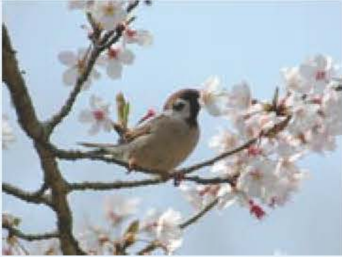
写真 中西榮子さん(鳥の博物館友の会会員) 文 塩田いづみ(鳥の博物館学芸員)