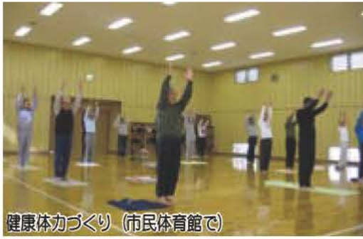
健康体づくり (市民体育館で)