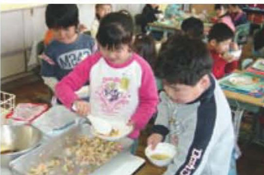
◀我孫子産米のちらし寿司

市内小中学校の給食の米は、これまで千葉県学校給食会から供給される県内産の米を使用してきましたが、4月からは全校で我孫子産の「コシヒカリ」に変えました。 我孫子産米の使用は農産物の「地産地消」の推進につながるのと同時に、子どもたちと農業者が顔の見える関係になり、地域に根ざした「食育」を進めることができます。 市は、地元農家からの玄米の集荷や保管、精米、配送などの業務を、東葛ふたば農業協同組合に委託しました(委託費630万円)。農業協同組合は、学校給食用に市内に新設した精米設備(写真上)と保冷庫を使って、米飯給食の日程に合わせて精米し学校に届けます。全校の年間使用量はおよそ84tで、玄米で約1600俵分になります。 ☎ 教育委員会学校教育課 ☎ 7185・1267