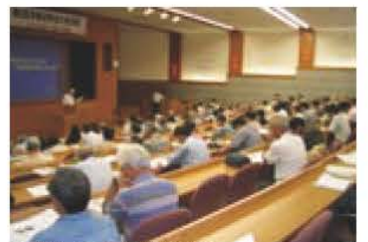
▲昨年(2005年)の手賀沼学会

手賀沼学会では、7月開催予定の大会で発表していただける「手賀沼学」に関する発表者と作品を募集します。 「手賀沼学」は手賀沼流域で育まれた文化の総体。手賀沼学会は子どもから大人までが自由に学び、交流する場です。 日時 7月8日(土)午前10時から 場所 中央学院大学 対象 手賀沼に関する自然・文化・歴史・生物・市民活動などに関する口頭発表(研究報告などで30分程度)と展示発表(ポスター、写真、調査レポートなど)