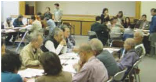
▲地域の課題に取り組む市民活動団体

世界の恒久平和は、人類共通の願いである。しかしながら、今日なお世界の動きは、核戦争の危機をはらみ、誠に憂慮にたえない。わが国は唯一の被爆国として、核兵器の恐ろしさと、被爆者の苦しみを全世界の人々に訴え、再び広島・長崎の惨禍を繰り返してはならない。我孫子市は市民の生命と安全を守るため、いかなる国のいかなる核兵器に対しても、その廃絶を求め、ここに平和都市を宣言する。