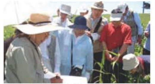
▲春の自然観察の様子

日時・集合場所 5月27日(土)午前8時50分、老人福祉センター つつじ荘駐車場(小雨実施) 内容 植物や鳥などの観察 定員 先着30人 参加費 無料 持参 筆記用具、水筒 ※動きやすい服装でご参加ください。